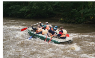
...tak jsme se plavili po řece Moravě...