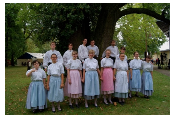
Tanečnice a tanečníci, naši „Nadějíci“ připraveni vystoupit na Třebovickém koláči