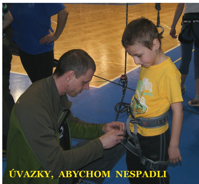
ÚVAZKY, ABYCHOM NESPADLI