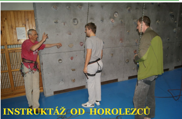
INSTRUKTÁŽ OD HOROLEZCŮ