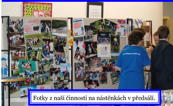
Fotky z naší činnosti na nástěnkách v předsálí.

A je to tady. Ples pomalu začíná. Chystáme sál i předsálí. Svůj stánek s vlastními výrobky mělo i sdružení PRAPOS, kam chodí do denního stacionáře řada našich Nadějků a hudební skupina PRAPOSÁCI nám zahrála, jako host plesu.