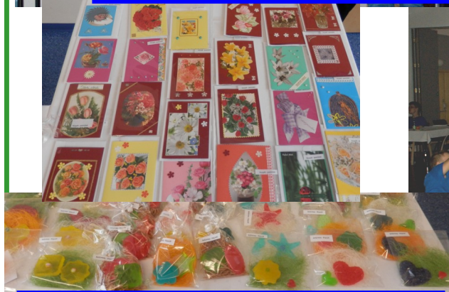
Výrobky šikovných rukou našich členek – maminek