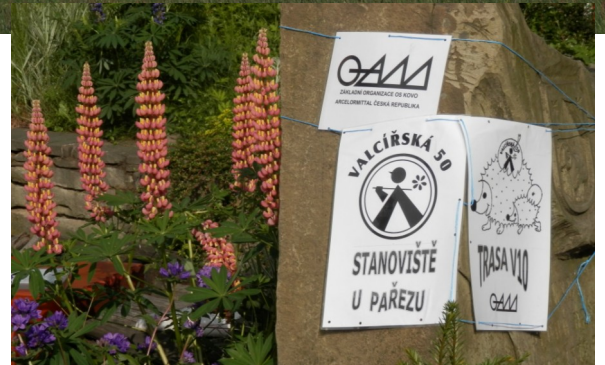
JDEME TAKÉ KOLEM ŘÍČKY ČELADENKY