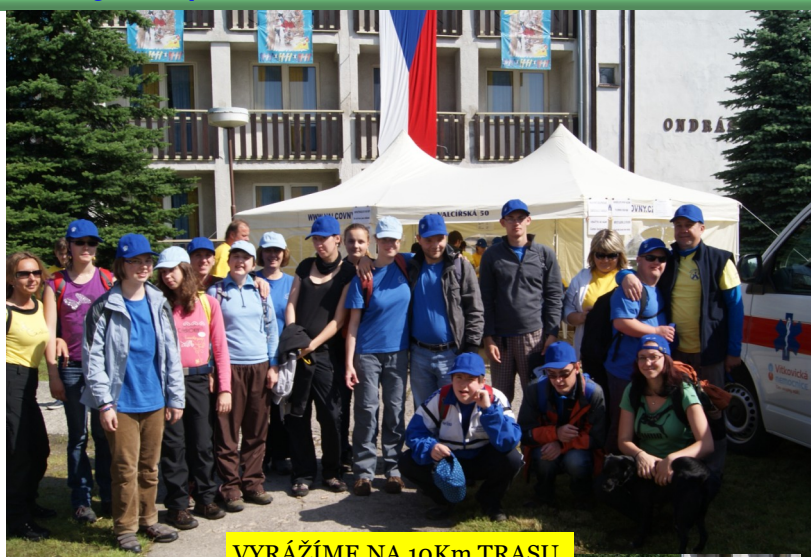
VYRÁŽÍME NA 10Km TRASU

Na letošním 41.ročníku nám přálo počasí a převážnou část dne svítilo sluníčko. Jak jste si právě přečetli, V50 má již dlouholetou tradici. Založili ji zaměstnanci tehdejší Nové hutě a trvá nepřetržitě do dnešních dnů, což znamená, že je jednou z nejstarších turistických akcí v České republice.