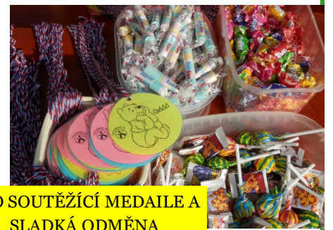
PRO SOUTĚŽÍČÍ MEDAILE A SLADKÁ ODMĚNA