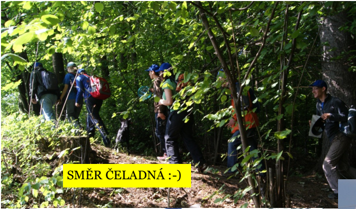
SMĚR ČELADNÁ :-)