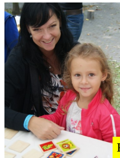
Pexeso a hádání předmětů hmatem :)