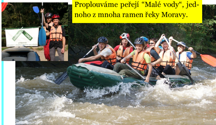
Proplouváme peřejí "Malé vody", jednoho z mnoha ramen řeky Moravy.

Po dojezdu na místo nalodění doplňujeme tekutiny, prezujeme se do raftové obuvi, oblékáme záchranné vesty, nasazujeme zpět přilby a dostáváme pádla. Mezitím jsou již rafty připraveny (nafouknuty), každá ze tří lodí veze sebou pumpu pro případné potřebné dofouknutí. Opatrně nastupujeme, jsou nám určena místa, kde máme sedět. Do každého plavidla nastoupí "kapitán a kormidelník v jedné osobě" a vyrazíme na vodu.