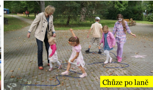
Chůze po laně

děvčat se vyklubaly velice zdatné zatloukačky a myslím, že byly v této činnosti i šikovnější. Na mé otázky, kdo je naučil této dovednosti, odpovídali v naprosté většině, že děda ..... kde jsme my tatínkové !!?? :-)