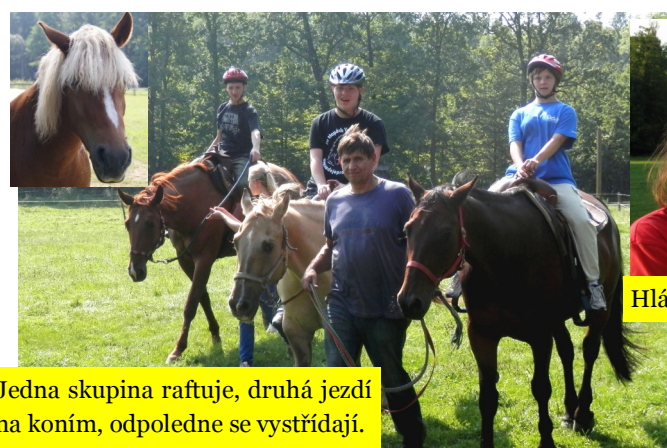
Jedna skupina raftuje, druhá jezdí na koních, odpoledne se vystřídají.

Po 50 metrech vstupujeme pod mostem do náruče hučící peřeje. Někteří z nás to odnesli mokřými zadky, ale hlavně jsme si peřej užili a zakřičeli si při jejím proplouvání. Máme i diváky, a to cyklisty, kteří sledují náš průjezd peřejí v bezpečí na mostě nad "Malou vodou", jedním z ramen řeky Moravy. Řeka se točí nesčetnými zákrutami, máme co dělat, abychom se udrželi v optimálním proudu, občas se zaklesneme do stromů spadlých do vody. Místy musíme rychle sklonit hlavy dolů pod větve, které jsou příliš nízko nad hladinou řeky, helmy nám přicházejí vhod. Zatímco první skupina si pluje po "Malé vodě", druhá nasedá na koně a projíždí okolí Lovecké chaty za nezbytného doprovodu vodičů koní.