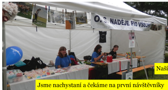
Jsme nachystaní a čekáme na první návštěvníky