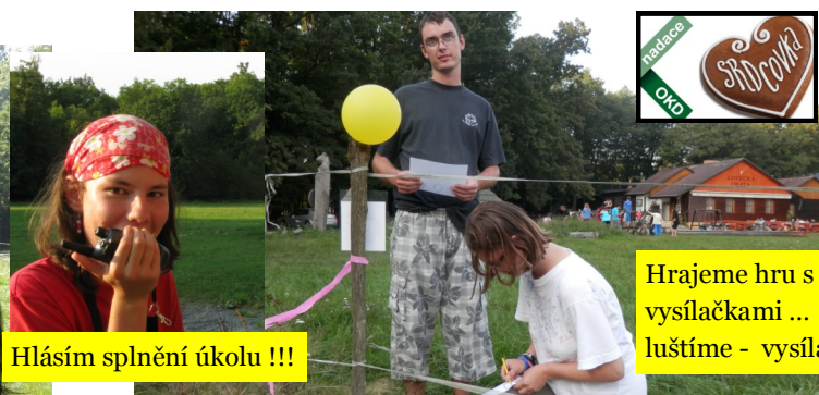
Hlásím splnění úkolu !!!