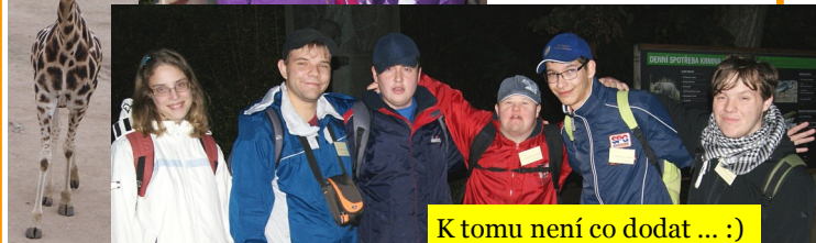
K tomu není co dodat ... :)

Po dvou (až třech :-P) přestupech vystupujeme na našem „Drtikolu“, odtud je to už jen kousek do penzionu. Všichni se těšíme na večeri, tak se rychle sejdem v jídelně. Zbylo nám spousta pizzy, a také máme rohlíky, chléb, paštiky, máslo, sýr... Každému nachystáme dle chuti. Kupodivu ještě dojídáme - ale už opravdu poslední jídlo z domova :-). Po večeri tradiční očista a šup do pyžama. Dámy si ještě chvíli povídají, pánové sledují kousek filmu „Jak se krotí krokodýli“ a brzy usínáme po dni plném zážitků stráveném venku.