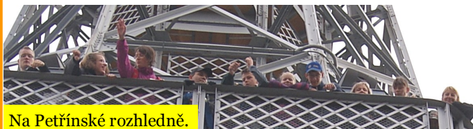
Na Petřínské rozhledně.

Kdo má zájem, může vylézt až nahoru. Rozdělujeme se tak na 2 týmy – tým “A“ mává a fotí se zespodu. Odvážný a zdatný tým “B“ vystupuje a mává shora.