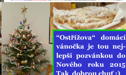
"Ostřížova" domácí vánočka je tou nejlepší pozvánkou do Nového roku 2015 Tak dobrou chuť :)