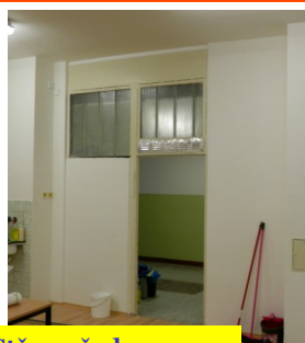
Stěna před opravou