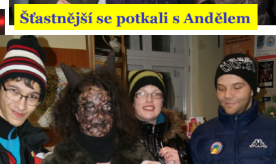
Čerta se nebojíme :)