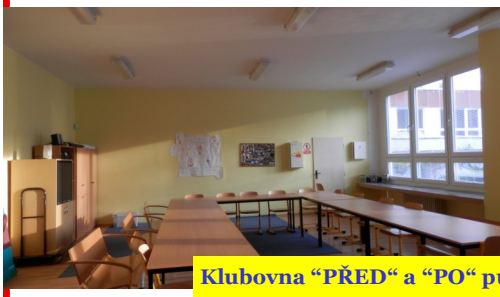
Klubovna "PŘED" a "PO" půlročním snažením