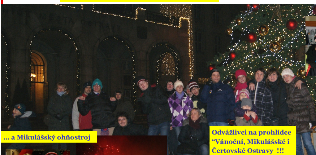
... a Mikulášský ohňostroj