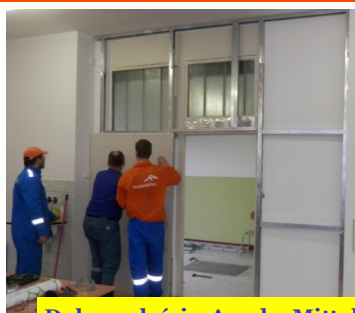
Dobrovolníci z ArcelorMittal Ostrava