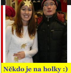
Někdo je na holky :)