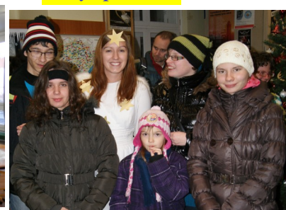
Šťastnější se potkali s Andělem