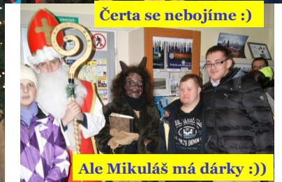
Ale Mikuláš má dárky :)