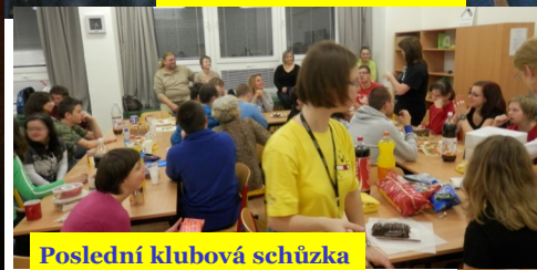
Poslední klubová schůzka